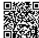
修理サービス規程