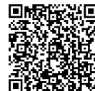
メーカー保証規程

ご不明な点並びに修理に関するご相談は、お買い上げの販売店（工事店）または弊社ご相談センターにお問い合わせください。その際は商品の形名、お買い上げ時期、故障の状況などをお知らせください。