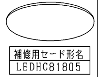
補修用セード形名 LEDHC81805