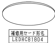
補修用セード形名 LEDHC81804