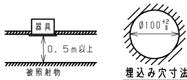
埋込み穴寸法 天井取付け厚さ: 5mm~25mm